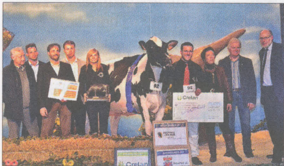
Floreta de l'Herbagère (p. Goldwyn), déjà sacrée championne primipare, remporta le challenge Nalux.

Le 6 avril dernier fut organisée la Nuit de la Holstein à Libramont. La concurrence y fut très rude avec près de 170 animaux au catalogue. L'édition fut arbitrée par un jeune juge belge, Tjebbe Huybrechts assisté par son ami néerlandais Wouter De Bruin. Le show Benelux confirma son niveau européen.