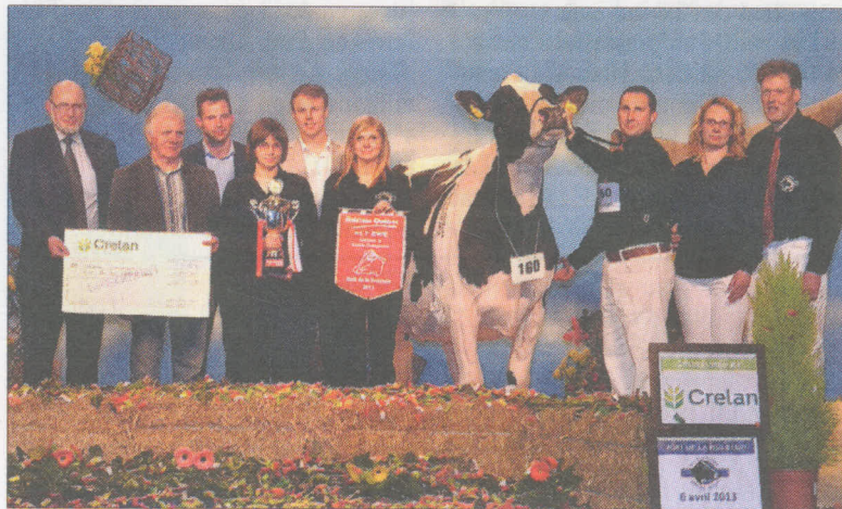
Bons Holsteins Ella (p. Mailing), appartenant à Bons Plooy Mts, de LD Ottoland (NL), fut désignée grande championne de la Nuit de la Holstein.

Bons Holsteins Koba (p. Jasper) appartenant à Bons Plooy MTS, de LD Ottoland (NL), remporta le titre de championne intermédiaire. Elle fit la différence par son angularité plus exprimée par rapport à la championne réserve Finale de Bois Seigneur (p. Shaker) appartenant à